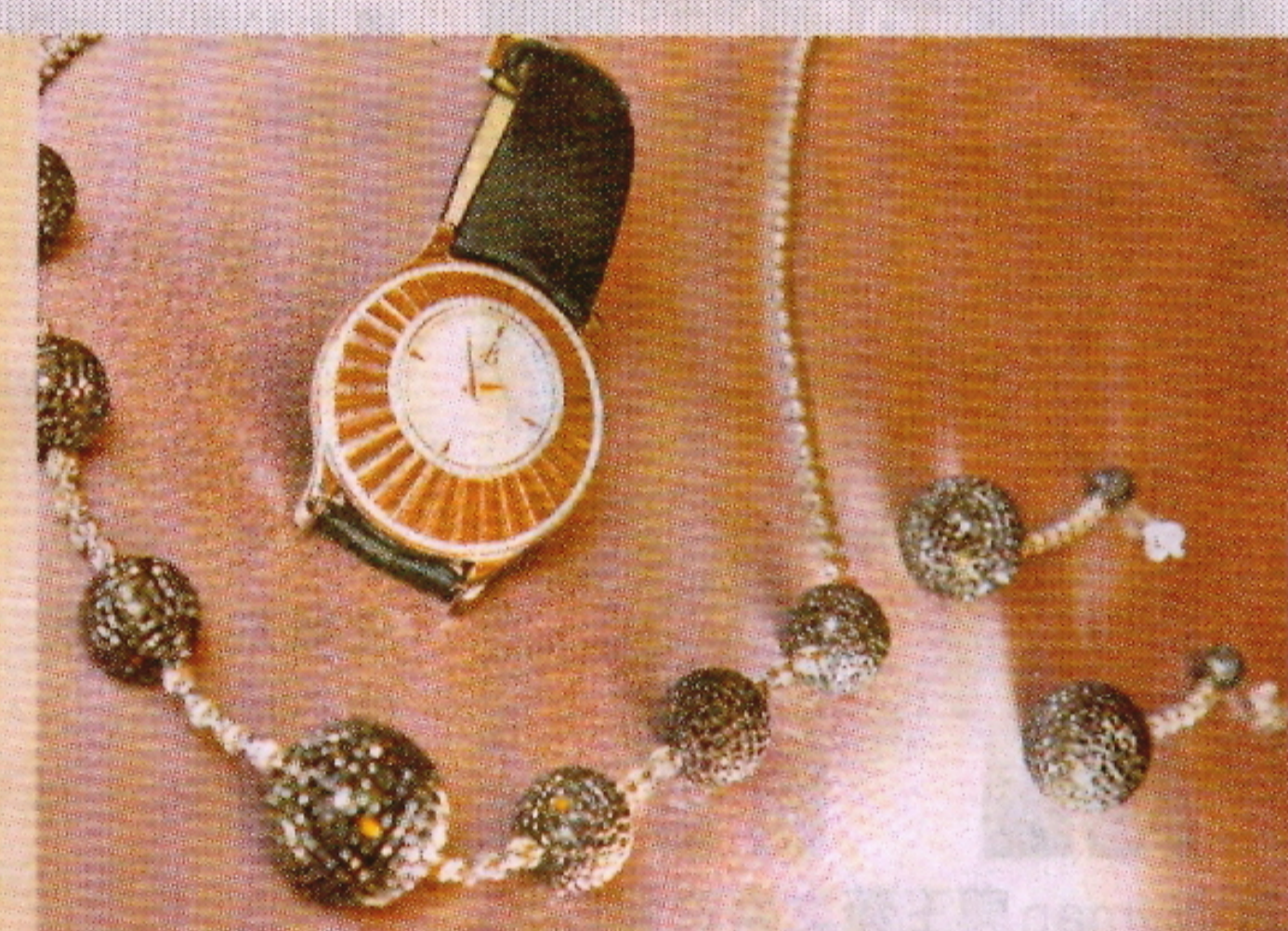
用上超過1,500顆黑鑽鑲嵌的頸鏈，以不同大小的珍珠球狀組成，設計年輕又予人神秘莫測的感覺。Stria 設計靈感擷取自浪漫的地中海海洋瑰寶，以不銹鋼錶殼的裝飾勾畫出細膩的波浪紋，並鑲有162顆美鑽，配以白色天然珍珠貝母錶盤及黑色緞面錶帶，就如貝殼反射出和煦光滑的光線。 重39.4卡黑鑽 18K白金頸鏈 $215,430 重14.29卡黑鑽、1.68卡鑽石 18K白金耳環 $91,260 Stria 不銹鋼鑽石腕錶 $58,000