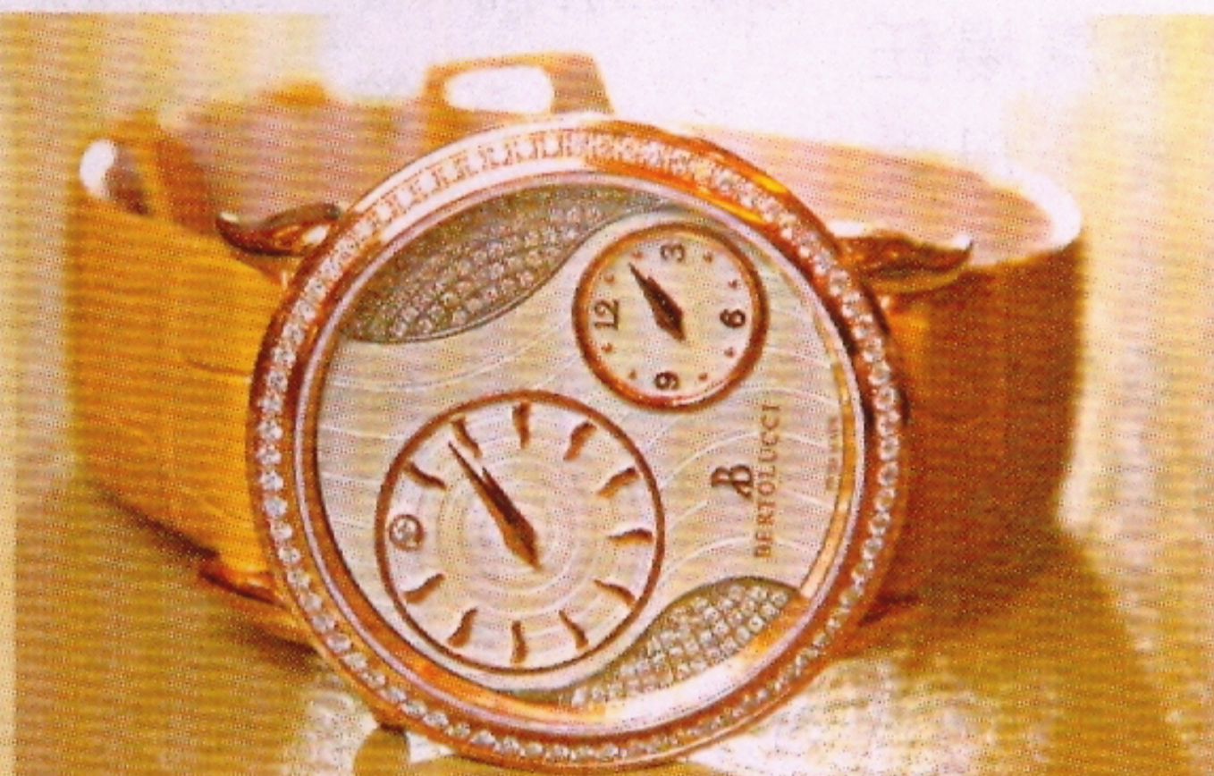
Volta 不銹鋼鑽石腕錶 $148,000

這款 Volta 腕錶以海底反射的陽光作為設計藍本，銀白色乳光綴波浪圖案錶盤，配上黃土色的鱷魚皮錶帶，完全感受到陽光明媚的意大利 Riviera 風情。