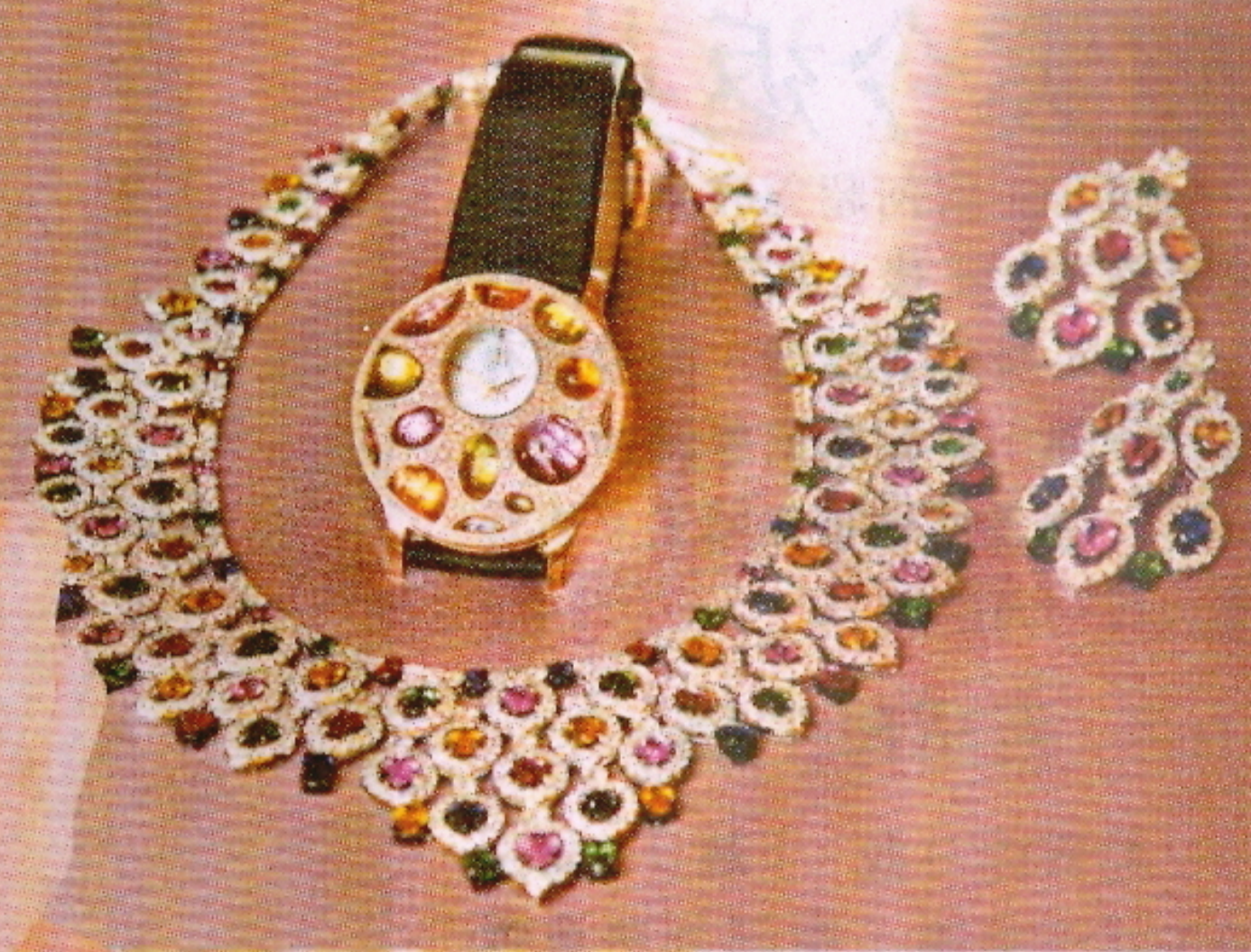
重57.14卡彩色寶石、30卡鑽石 18K白金頸鏈 $783,900 重9.96卡彩色寶石、6.76卡鑽石 18K白金耳環 $180,180 Stria Luce (訂做系列) 18K金彩鑽腕錶 $450,000

最新 Stria 經典之作 Stria Luce，為了獻給地中海岸美艷動人的繽紛色彩及耀眼光芒，360度旋轉錶殼鑲了331顆足面切割 VVS 鑽石及14顆紫水晶、橄欖石、淺藍色黃晶及橙色黃水晶，錶盤旋轉時彩色裝飾外緣閃閃生輝，讓貝殼精緻的波浪紋在特別雕刻的圓弧造型閃爍不已，成為五光十色的彩裝腕錶。