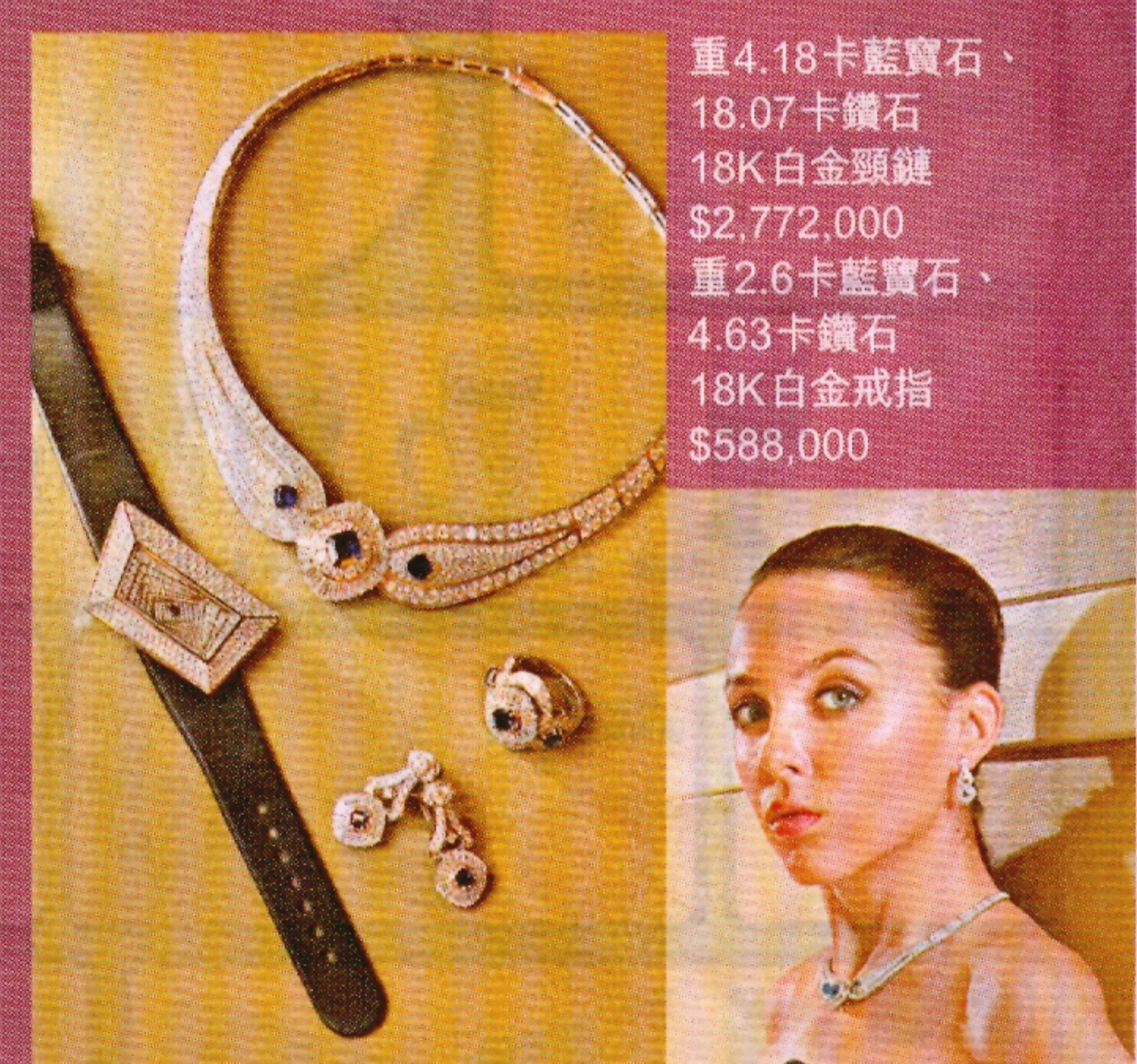
重4.18卡藍寶石、18.07卡鑽石 18K白金頸鏈 $2,772,000 重2.6卡藍寶石、4.63卡鑽石 18K白金戒指 $588,000