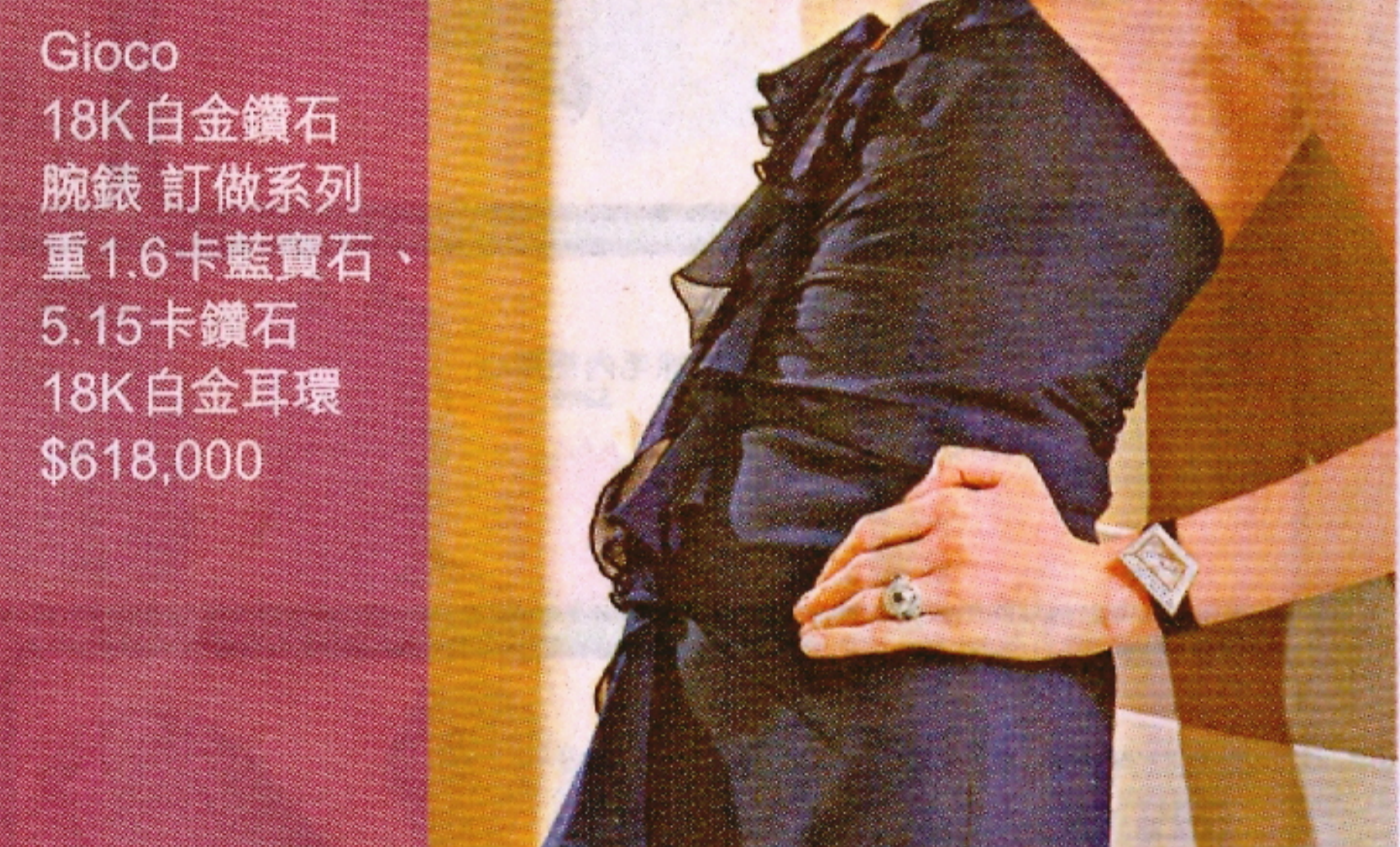
Gioco 18K白金鑽石腕錶 訂做系列 重1.6卡藍寶石、5.15卡鑽石 18K白金耳環 $618,000