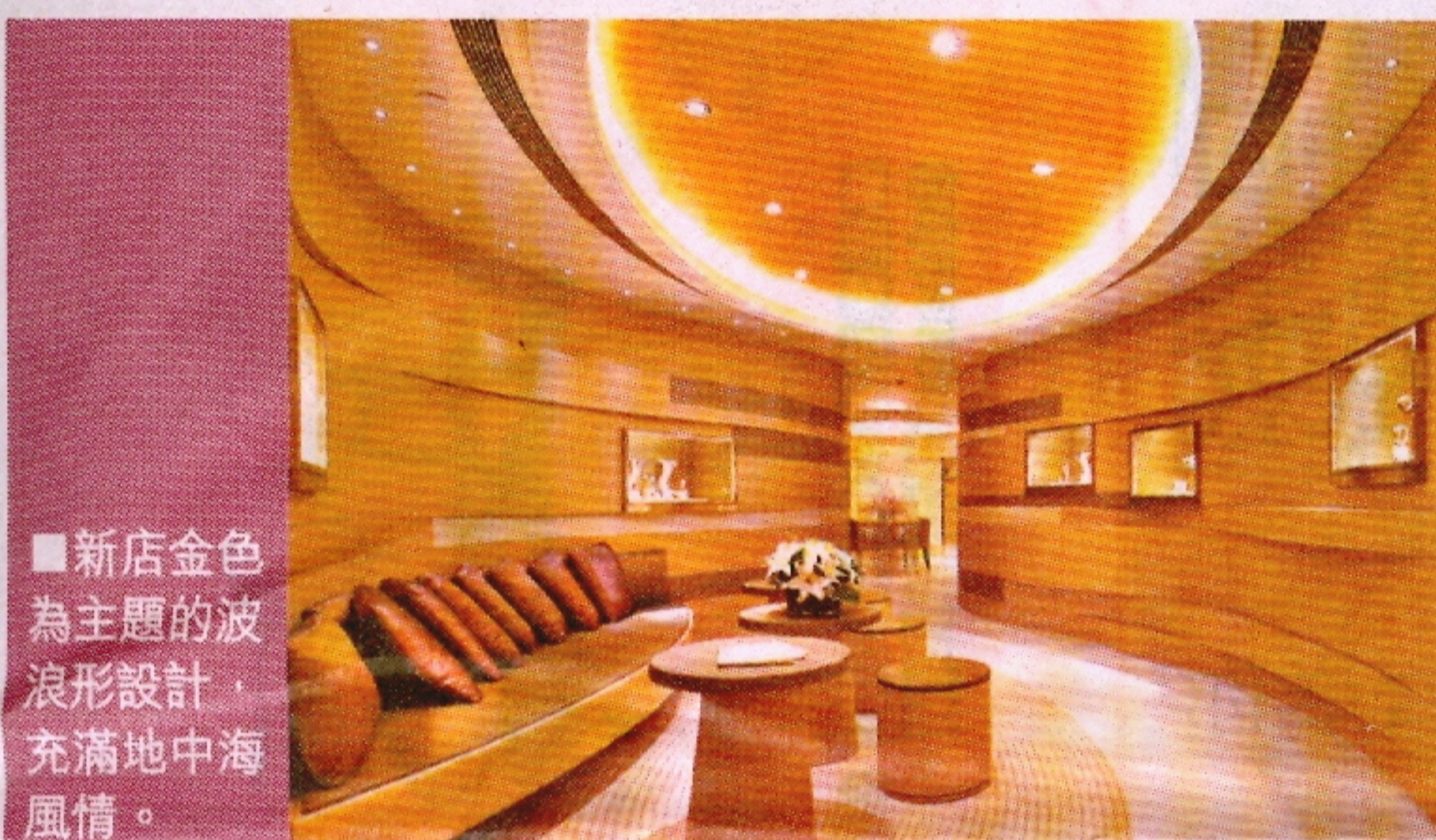
■新店金色為主題的波浪形設計，充滿地中海風情。

最新 Stria 經典之作 Stria Luce，為了獻給地中海岸美艷動人的繽紛色彩及耀眼光芒，360度旋轉錶殼鑲了331顆足面切割 VVS 鑽石及14顆紫水晶、橄欖石、淺藍色黃晶及橙色黃水晶，錶盤旋轉時彩色裝飾外緣閃閃生輝，讓貝殼精緻的波浪紋在特別雕刻的圓弧造型閃爍不已，成為五光十色的彩裝腕錶。