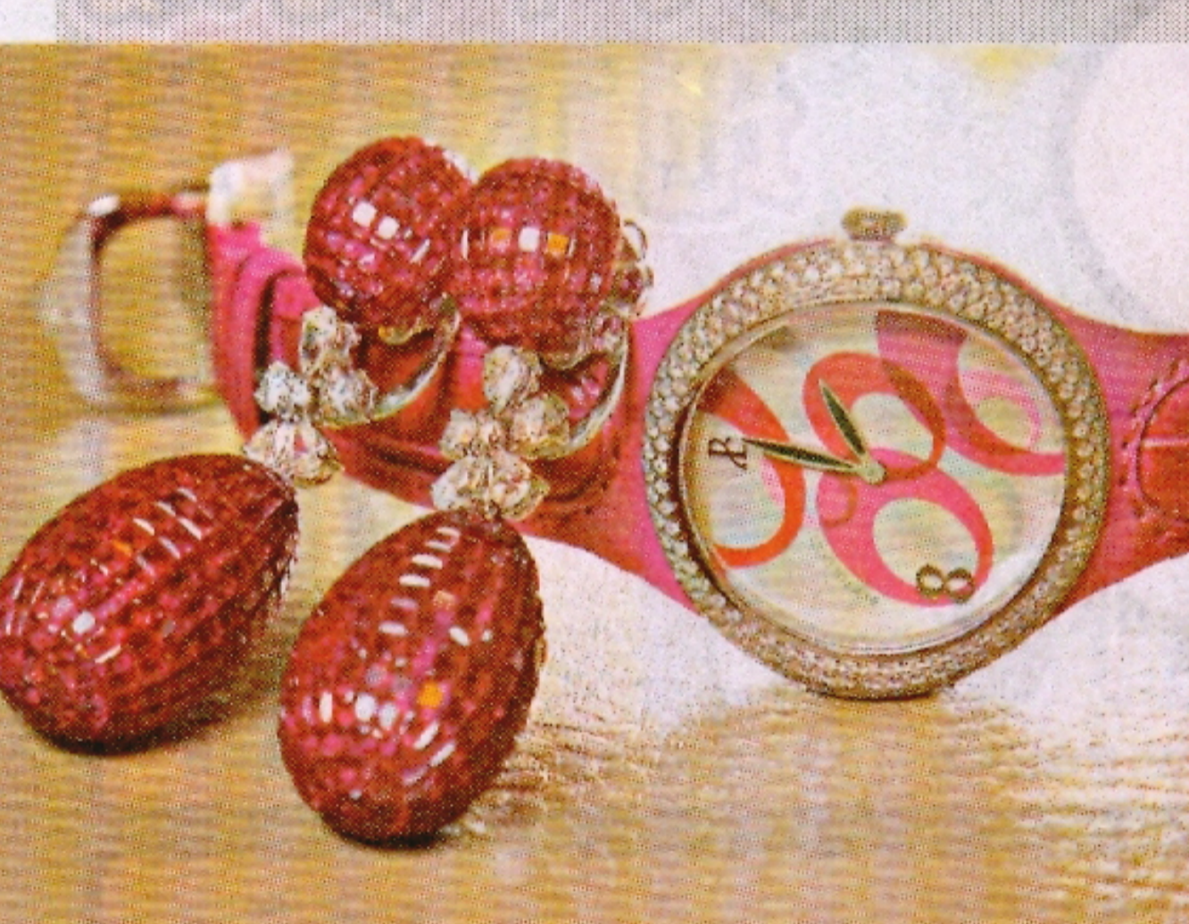
重108.12卡公主切割紅寶石、2.76卡鑽石 18K白金水滴形耳環 $462,150 Serena Garbo Baby Doll 桃紅色鱷魚皮鑽石腕錶 $79,000

感受 Encordia™ 擁愛系列非凡之美，請瀏覽 Forevermark.com 或親臨專屬珠寶商：周大福、周生生、俊文寶石店